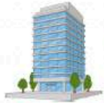
ส่วนกลาง