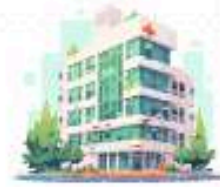
ส่วนภูมิภาค

บริหารจัดการหน่วยบริการ และขับเคลื่อนนโยบายสู่ การปฏิบัติ